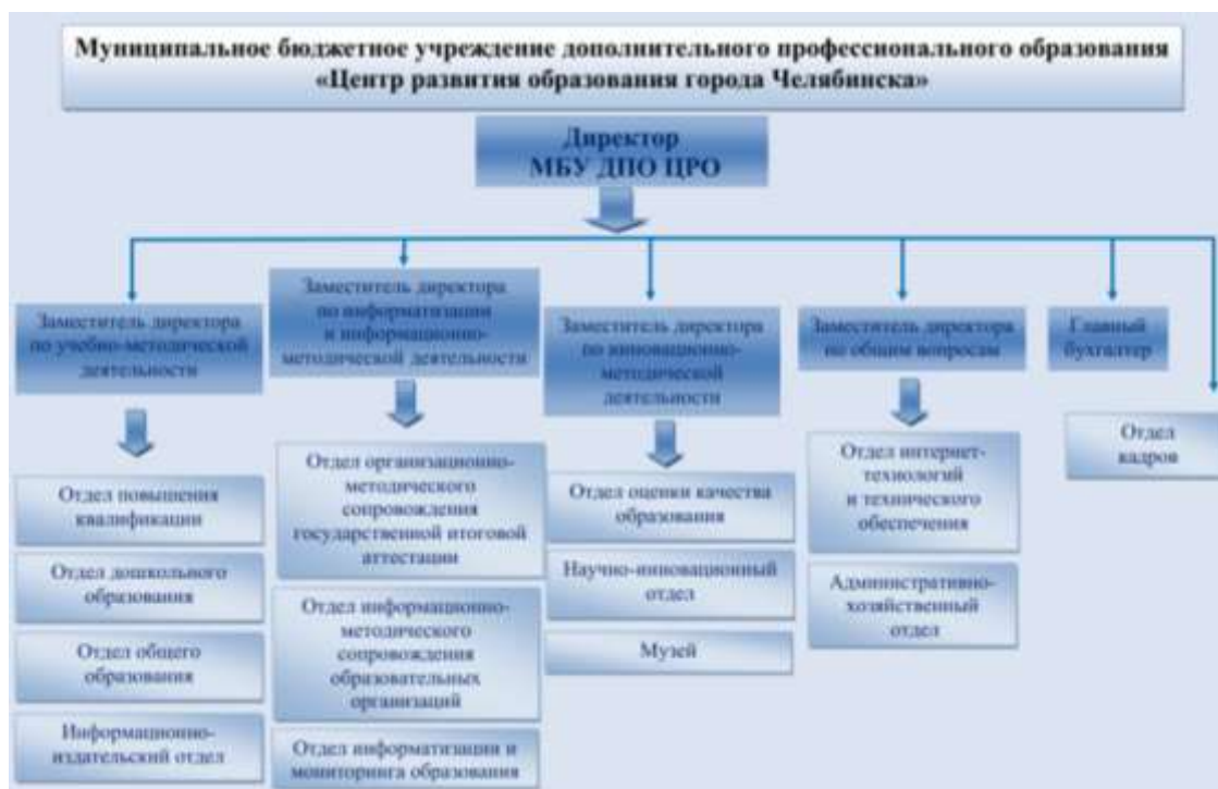
Рисунок 1. Структура Муниципального бюджетного учреждения дополнительного профессионального образования «Центр развития образования города Челябинска»

Организационная структура управления МБУ ДПО ЦРО, по состоянию на конец 2020/2021 учебного года, состоит из 13 отделов (рис. 1).