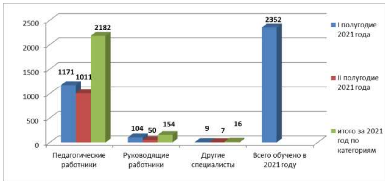
Рисунок 3. Количество обученных специалистов МОС на базе МБУ ДПО ЦРО в 2021 году по категориям (человек)

Количество педагогических работников МОС, обученных на базе МБУ ДПО ЦРО в 2021 году, составило 2182, руководящих – 154 и других – 16.