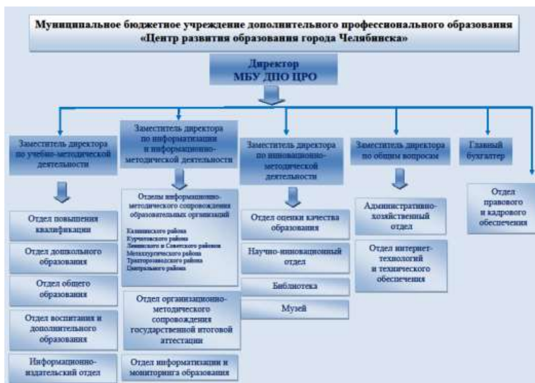
Рисунок 1. Структура муниципального бюджетного учреждения дополнительного профессионального образования «Центр развития образования города Челябинска»

Наряду с Положениями о структурных подразделениях их деятельность регламентируется правилами внутреннего трудового распорядка.