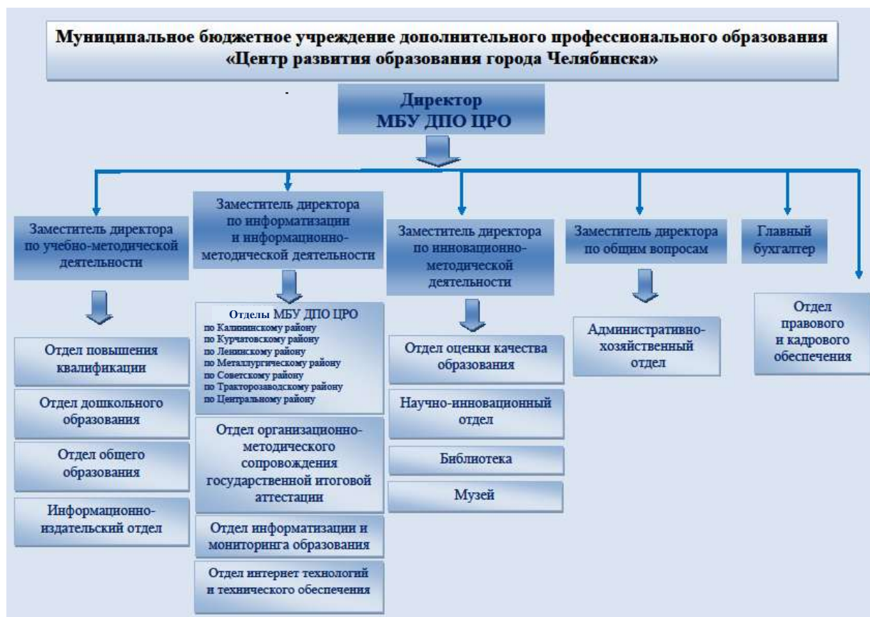
Рисунок 1. Структура муниципального бюджетного учреждения дополнительного профессионального образования «Центр развития образования города Челябинска»

Должностные инструкции в МБУ ДПО ЦРО разработаны и утверждены для всех сотрудников.