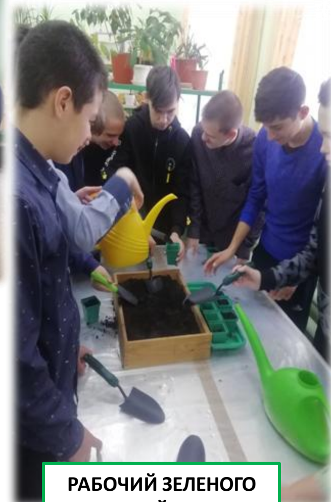
РАБОЧИЙ ЗЕЛЕННОГО ХОЗЯЙСТВА