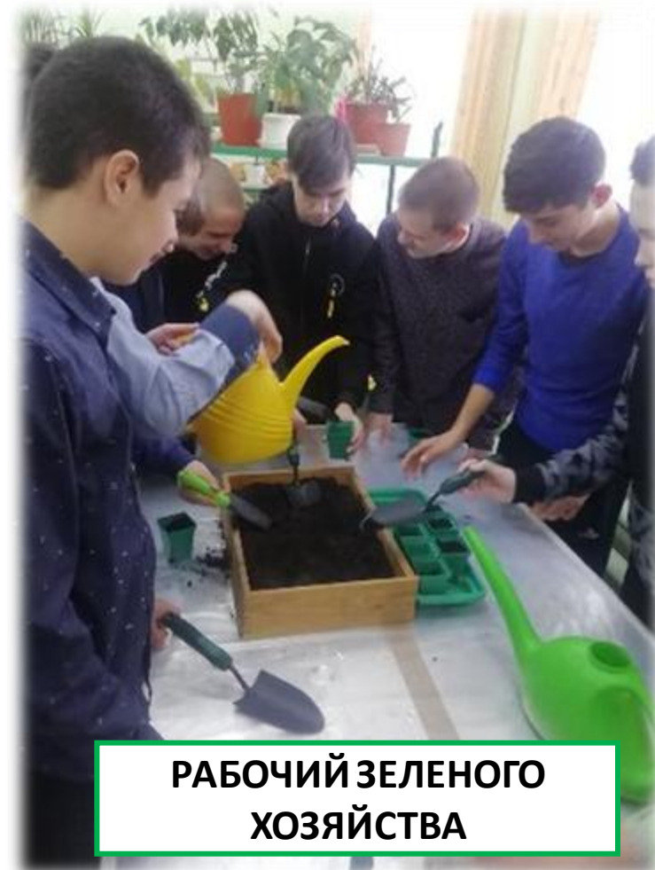
РАБОЧИЙ ЗЕЛЕНОГО ХОЗЯЙСТВА