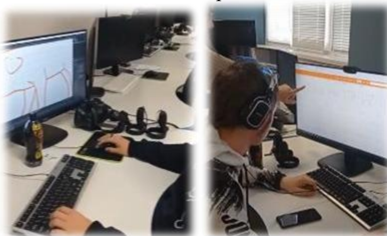
Курс «Разработка виртуальной и дополнительной реальности»