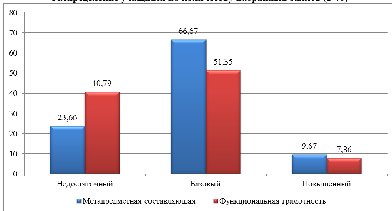
Распределение учащихся по количеству набранных баллов (в %)