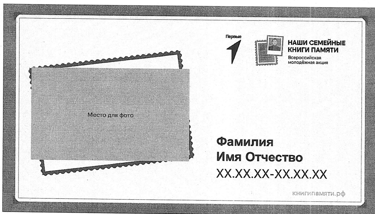
Слайд для горизонтальной фотографии

Возможны два варианта расположения фото в зависимости от ориентации фотографии – вертикальная или горизонтальная. Стоит выбрать только один из слайдов, второй удалить.