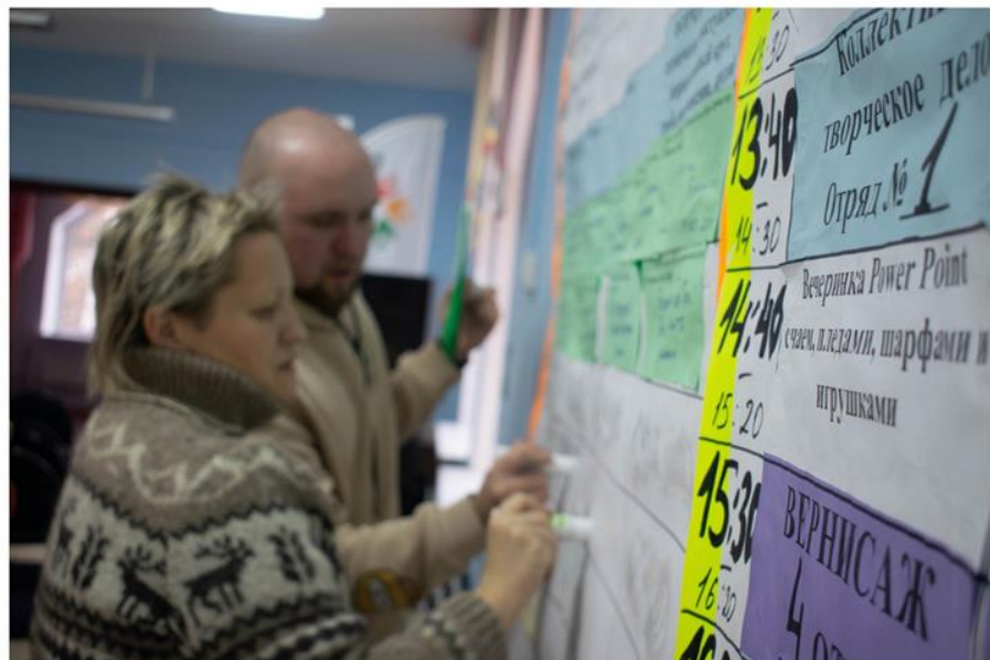
Зимний сбор ученического актива г. Челябинска