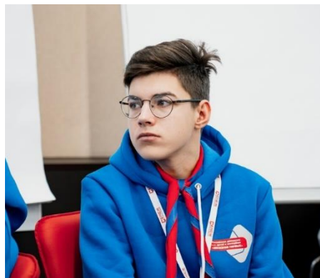
ВСЕРОССИЙСКИЙ ПРОЕКТ «ХРАНИТЕЛИ ИСТОРИИ»

– ребята, выполняя задания, узнают как стать добровольцем и почему делать хорошие дела — просто;