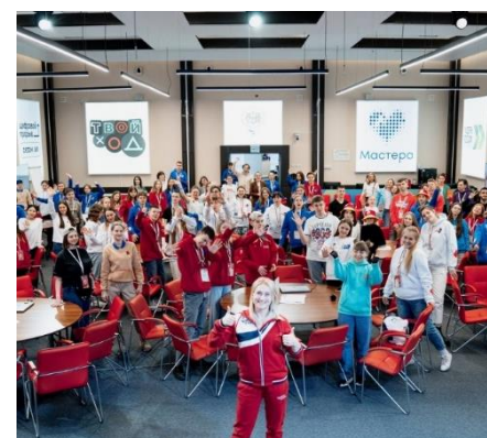
ВСЕРОССИЙСКИЙ ПРОЕКТ «МЫ – ГРАЖДАНЕ РОССИИ»

– участники изучат историю памятных мест и займутся просветительской работой, облагораживанием и косметическим восстановлением архитектуры памятных мест; · будут нести почётный памятный караул;