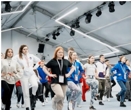
ВСЕРОССИЙСКИЙ СПОРТИВНЫЙ ПРОЕКТ «СЕМЕЙНАЯ КОМАНДА»

– школьники по всей стране будут посещать лекции и экскурсии в ВУЗах и на технологичных предприятиях;