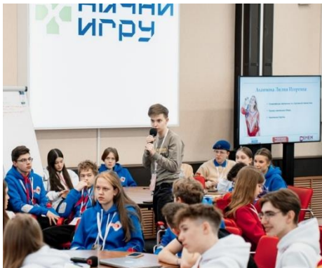
ВСЕРОССИЙСКИЙ ПРОЕКТ «В ГОСТЯХ У УЧЕНОГО»

– школьники по всей стране будут посещать лекции и экскурсии в ВУЗах и на технологичных предприятиях;