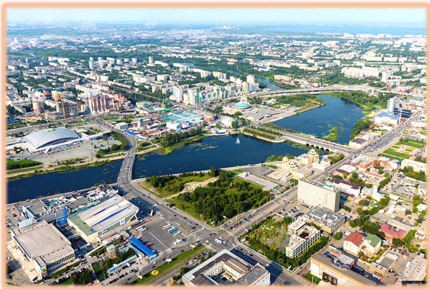
Челябинск с высоты птичьего полета

Область располагает богатыми и разнообразными природными ресурсами. Разведано около трехсот месторождений минерального сырья, Южный Урал является монополистом в России по добыче и переработке графита (95 %), магнезита (95 %), металлургического доломита (71 %), талька (70 %).