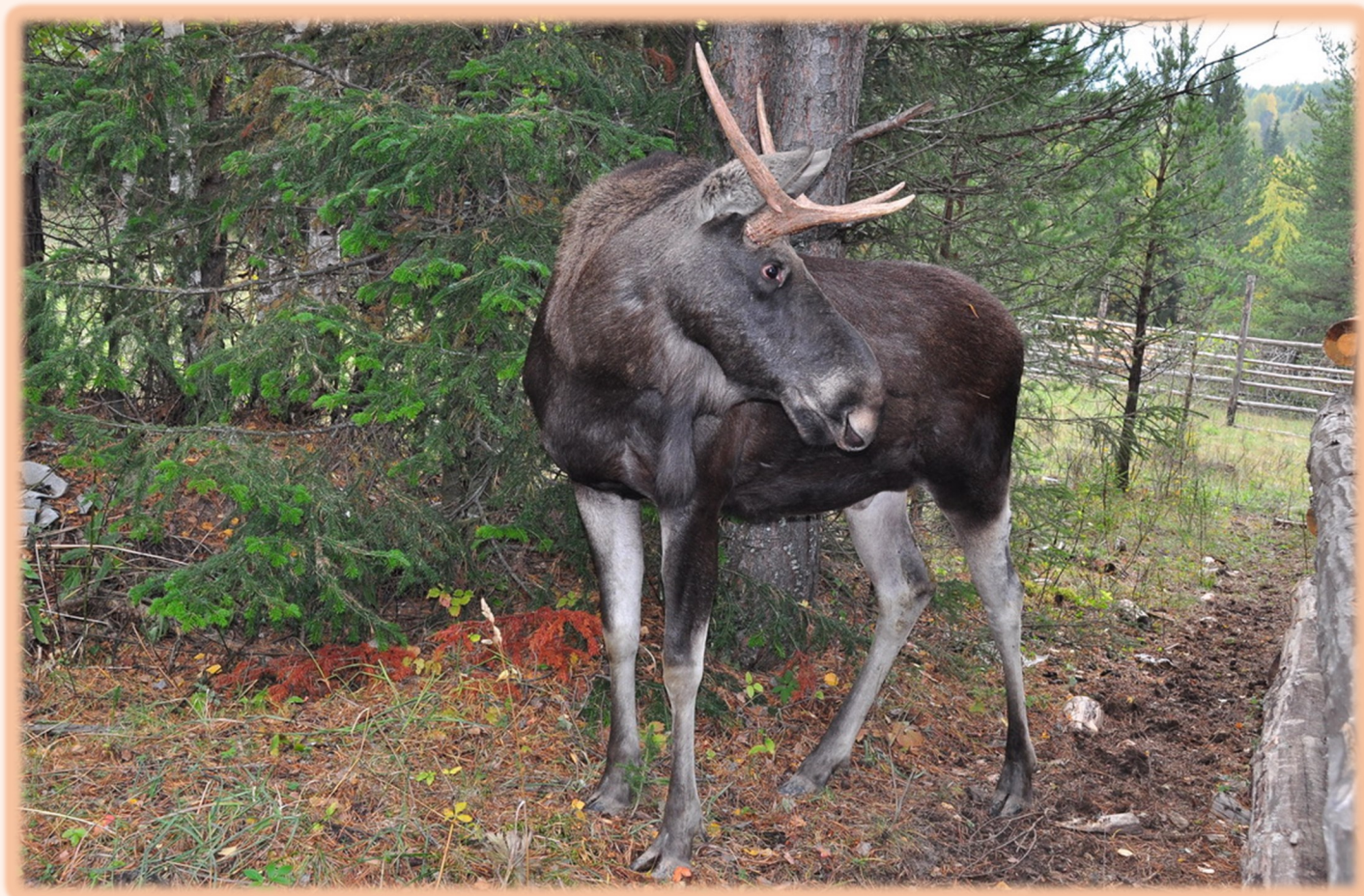
Национальный парк «Зюраткуль»

Сегодня в Челябинской области свыше 200 особо охраняемых территорий, являющихся хранителями национального природного наследия, в том числе два заповедника - государственный Ильменский заповедник и историко-археологический музей-заповедник «Аркаим», два национальных парка «Таганай» и «Зюраткуль», 150 памятников природы. Общая площадь, занимаемая особо охраняемыми природными территориями, составляет 1034 тыс. гектаров, или 11 % территории, а площадь заповедников и национальных парков – 220,8 тыс. гектаров, или 2,5 % общей площади.