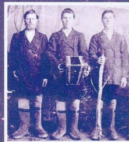
Русские Южного Урала Традиционная культура XIX–XX веков