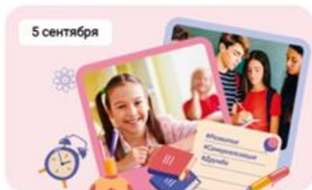
День знаний Подробнее ↗