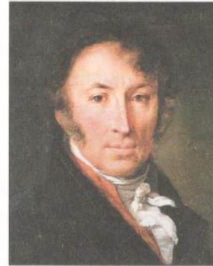
Н. М. Карамзин

► В Петровскую эпоху в связи с активной внешне-политической деятельностью Петра I в русский язык вошли многочисленные заимствования из немецкого, английского, голландского языков, связанные с военным и морским делом, механикой и техникой, государственным управлением. Это, например, слова армия, батальон, пушка, пистолет; флот, шлюпка, катер, матрос, юнга; фабрика, цех, инструмент, механик; губерния, паспорт, канцелярия, документ и др. Во время правления Екатерины II в русский язык также вошли слова из многих западноевропейских языков, но наиболее частотными были