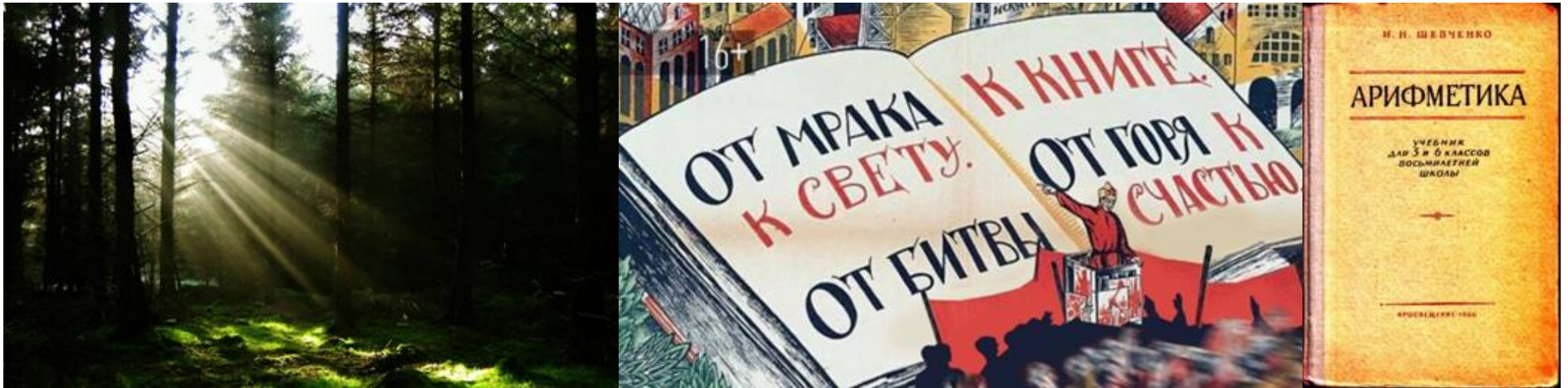
Просвет в лесу