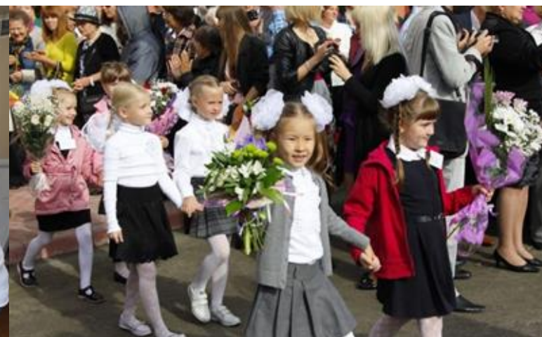
Дети идут в школу