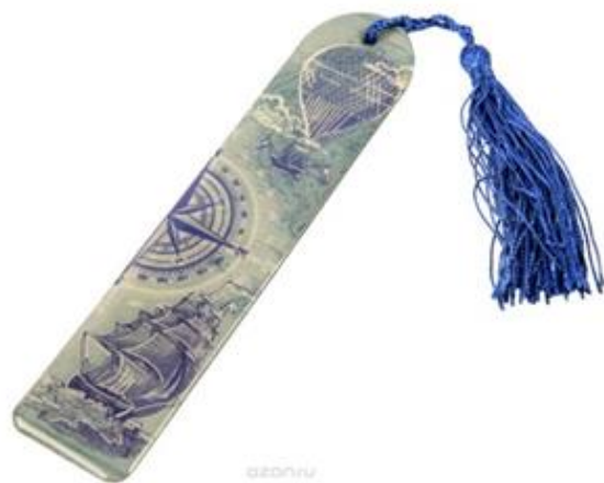
Закладка для книги