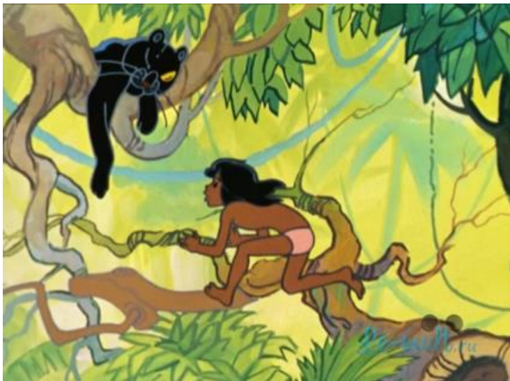
Багира - учитель Маугли