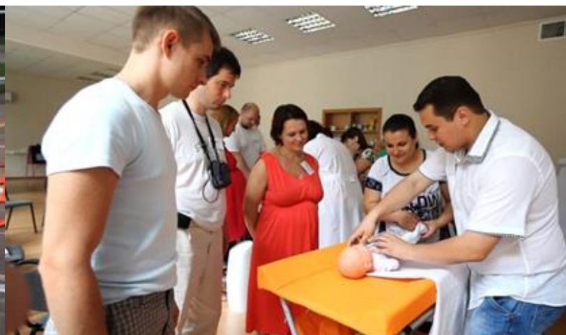
Школа молодых отцов