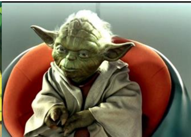
Учитель из «Звёздных войн»