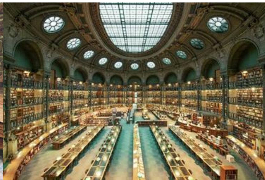
Зал, где читают книги