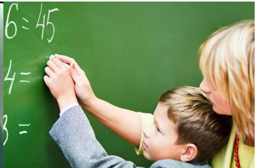
Учитель в школе