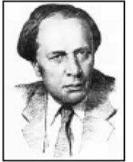
А. Н. Толстой (1882—1945)

Земля оттич и дедич — это те берега полноводных рек и лесные поляны, куда пришёл наш пращур жить навечно. Он был силён и бородат, в посконной длинной рубахе, солёной на лопатках, смышлён и нетороплив, как вся дремучая природа вокруг него. На бугре над рекою он огородил тыном своё жилище и поглядел по пути солнца в даль веков. ◀